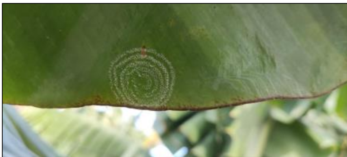
“La espiral de la Cochinilla”