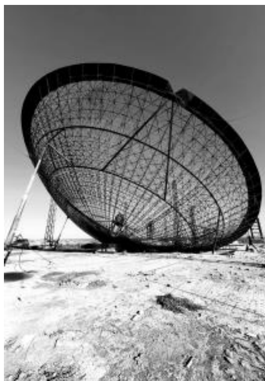
“Geometría de un paraboloides