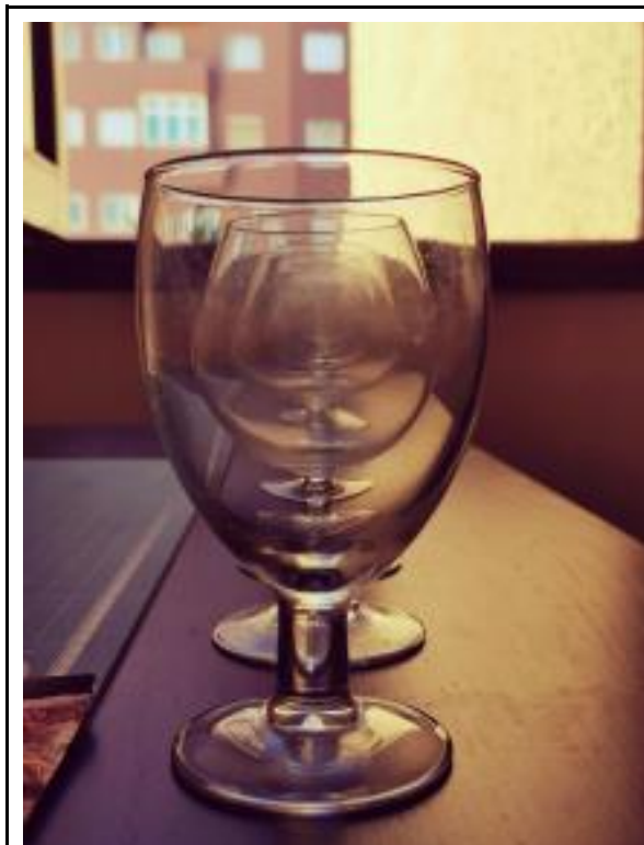
“Simplificación del Tamaño”