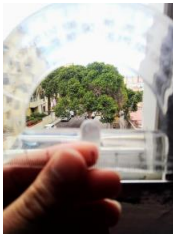
“El centro de la Vida”